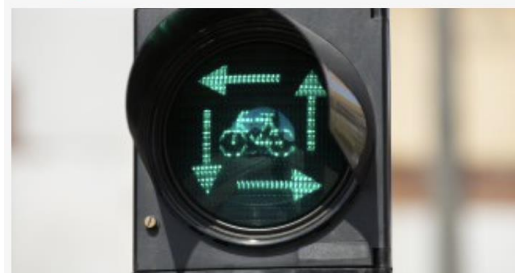
Opfrissing van de wegcode