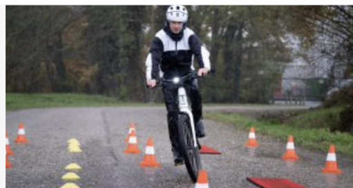
Veilig op de speedpedelec: theorie en praktijk