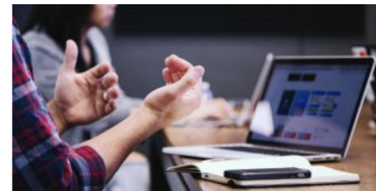
Online Veilig op de fiets: theorie