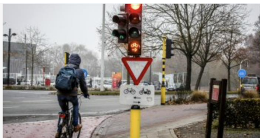
Veilig op de fiets: theorie en praktijk