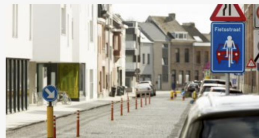
De verkeersregels in je buurt