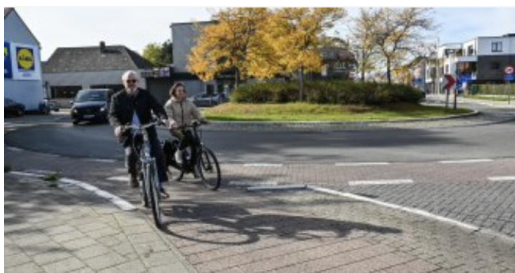
Veilig op de fiets: theorie