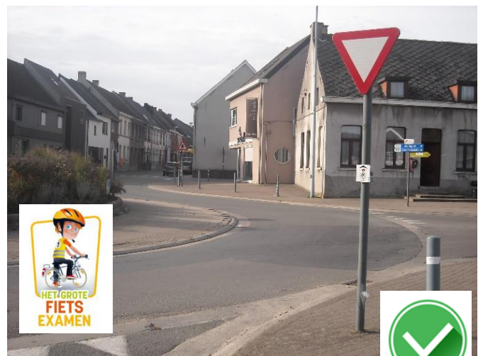
Rotonde Balegem: fietsexamen leert jongeren gevaarlijke punten inschatten.