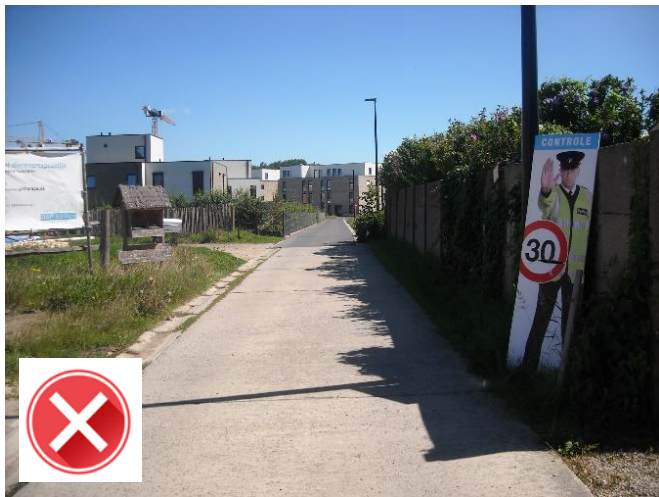
Snelheidscontrole aan Groot Bewijk met nepagenten: mooie (ondertussen verplaatste) foto maar niet efficiënt.