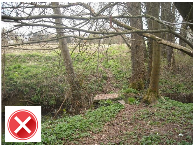
Fietsverbinding Balegem – Scheldewindeke gepland door dit natuurgebied.