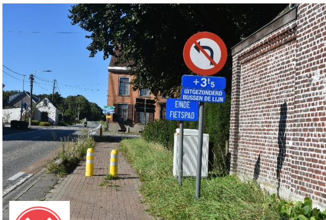
Geraardsbergsesteenweg Oosterzele: gevaarlijk einde van het fietspad.