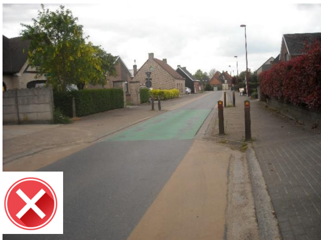
Wegversmallingen Meerstraat: fietsers moeten naar het midden van de rijweg uitwijken.