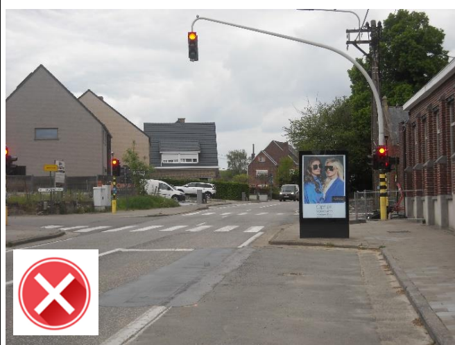
GILO Oosterzele: onveilige schoolomgeving door gebrek aan trottoirs en fietspaden. Reclamebord belemmert het zicht.