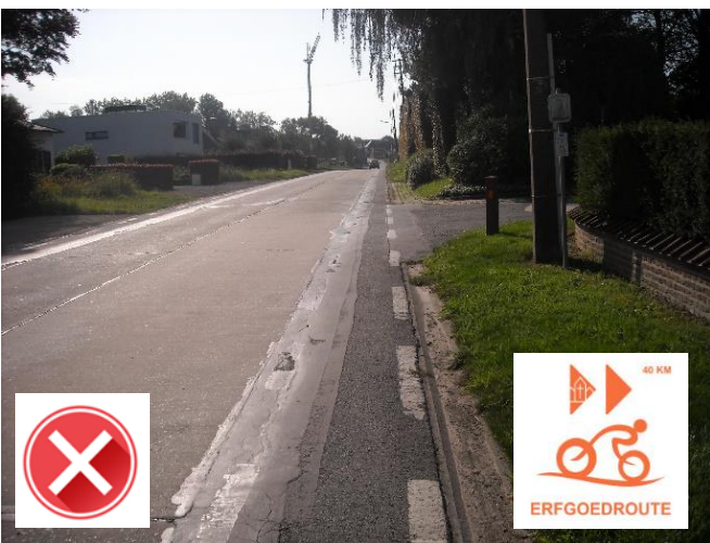
Houtemstraat – Bruisbeke: smal fietspad in slechte staat waar klein stukje erfgoedroute passeert.