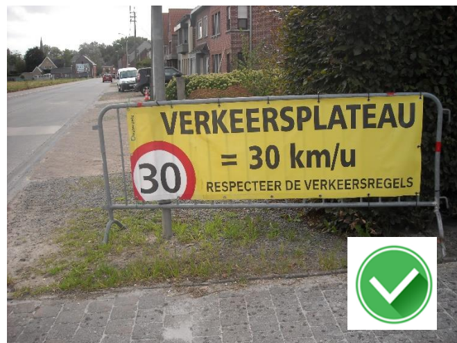
Vijverstraat: goed aangekondigd verkeersplateau met oversteekplaats voor fietsers.