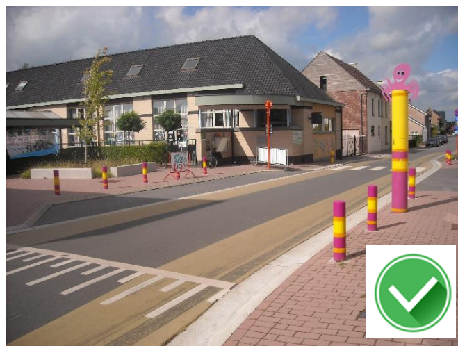
GILO Balegem: veiliger heringericht.