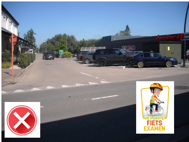
Station Scheldewindeke: autoparking vormt een gevaar voor fietsers.