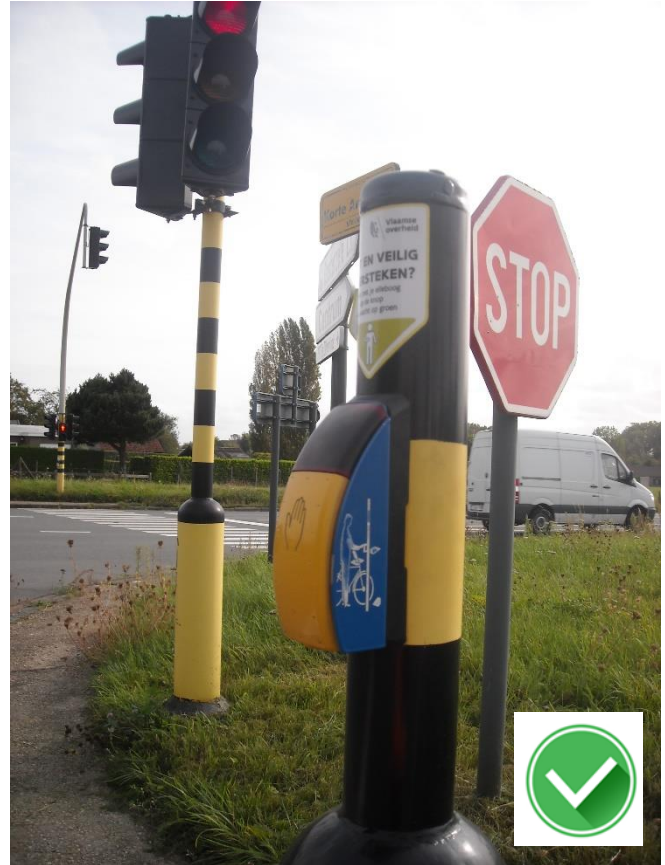
Reigerstraat – N42: vlotte bediening met hand of elleboog.