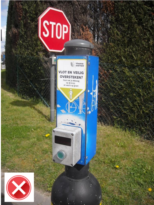
Houtemstraat – N42: duwen maar, met 1 vinger!