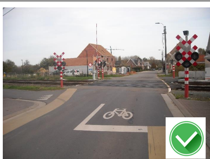
Kalle: duidelijke opstelstrook voor de spoorweg.