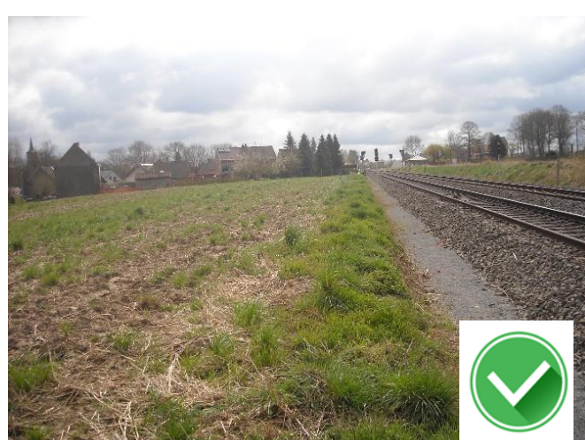
Fietsverbinding Balegem – Scheldewindeke langs spoorweg houden a.u.b.