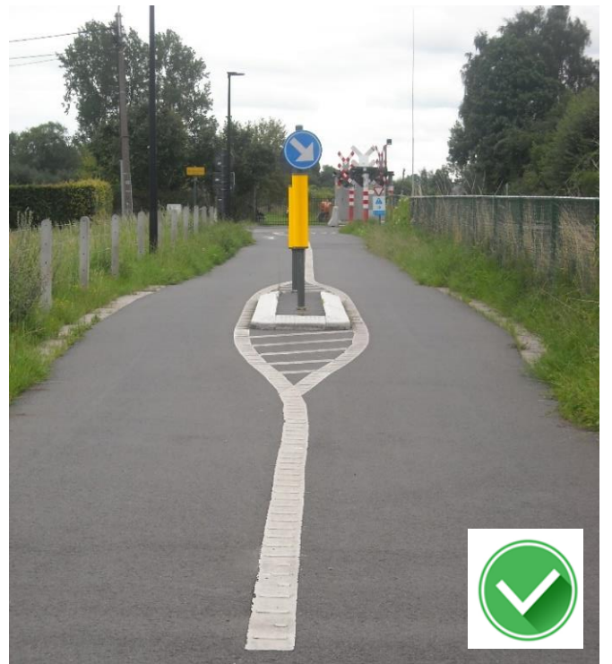
Fietsnelweg F417: goed aangegeven verkeerseilanden (markering en reflectoren).