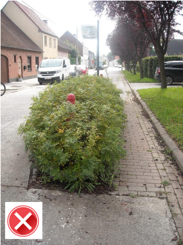
Dreef: niet gesnoeide haag belemmert doorgang voor fietsers.