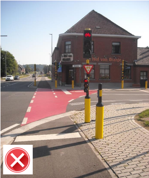
Hof van Oranje conflictvrij, maar voor fietsers linksaf enkele minuutjes erbij!