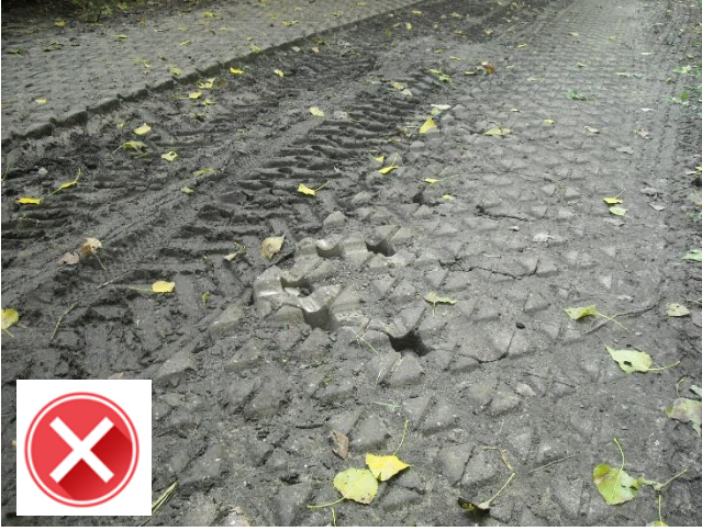
Maudeweg aan tractorsluis: slecht berijdbare strook voor fietsers.