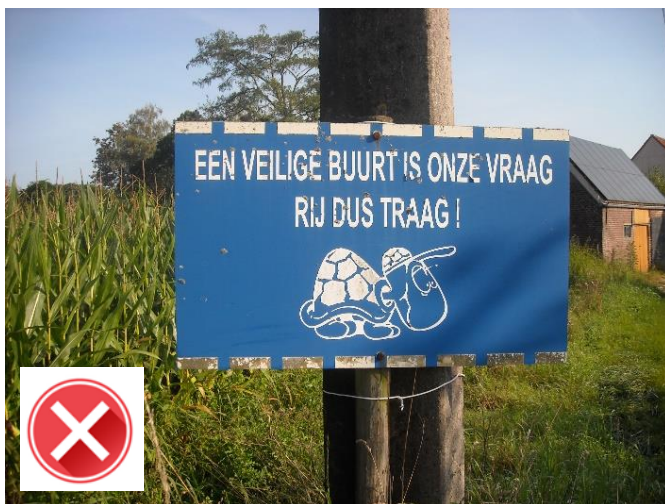
Ankerschooltje: sensibiliseringsacties zonder politiecontrole werken niet.