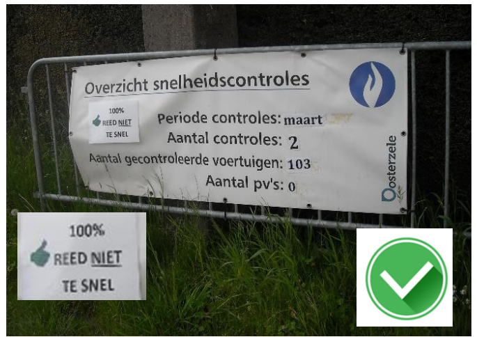
Snelheidscontrole in Issegem met echte agenten en niemand (!) reed te snel.