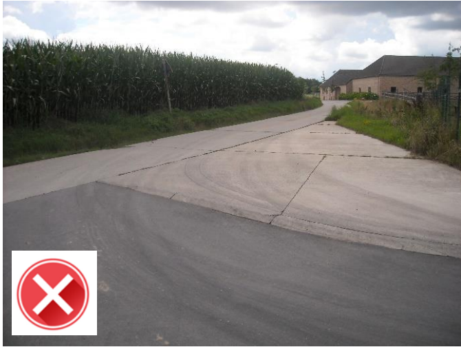
Uitrit aan Groot Bewijk: niet-gemarkeerde oneffen rand van de rijweg is gevaarlijk voor fietsers.