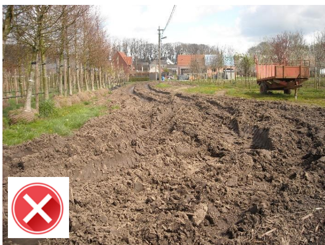
Verbinding Diepestraat – Berg dikwijls ontoegankelijk.