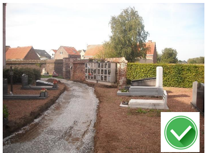
Gijzenzele Dorp: nieuwe trage en veilige weg achter de kerk voor kinderen naar Iboeschooltje (van kleuters tot leerlingen 4 de leerjaar).