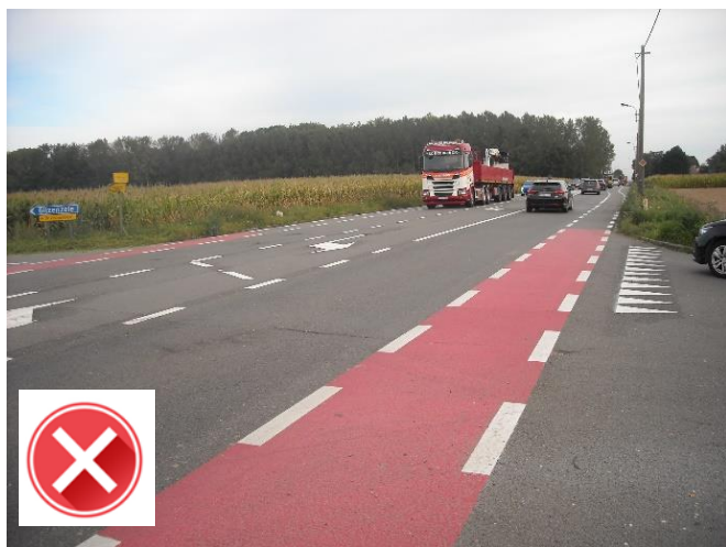
N42: gevaarlijke oversteek zonder verkeerslichten of opstelstrook aan Gijzenzelestraat. Beveiligde fietsoversteek noodzakelijk in afwachting van de (uitgestelde) definitieve herinrichting.