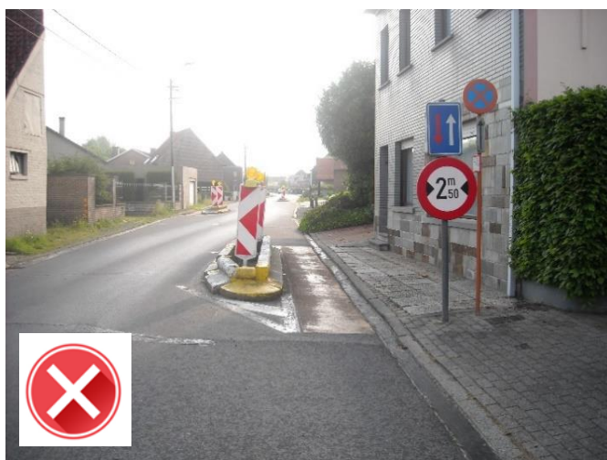
Reigerstraat: zware betonversmalling en veel verkeersborden nemen veel plaats in.