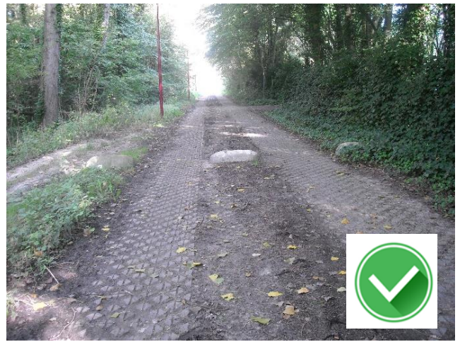
Maudeweg: tractorsluis houdt autoverkeer tegen.