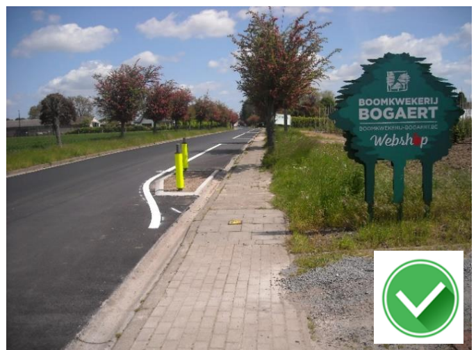
Windekekouter: sobere versmalling maar ook fietsers moeten naar links uitwijken.