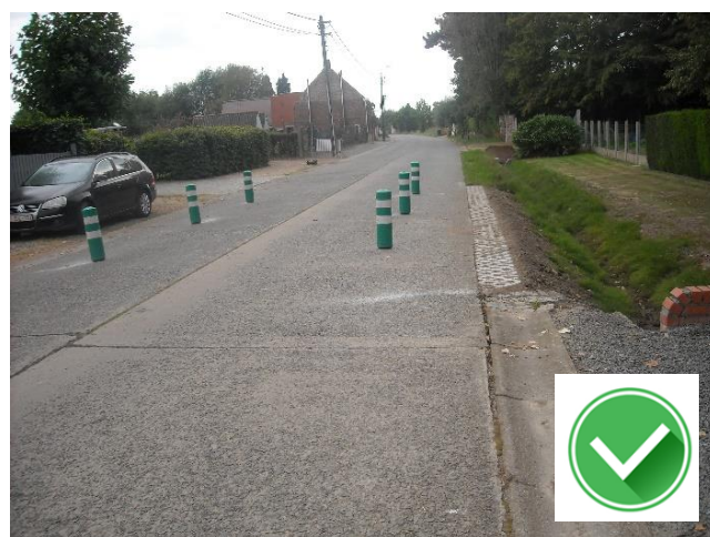
Wegversmallingen Houte: voor fietsers voldoende ruimte naast de paaltjes en veilig overrijdbare (vergevensgezinde) berm.