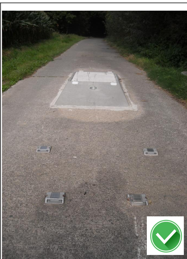
Wulgenstraat: tractorsluis met 2 extra reflectoren erop en knipperlichtjes ervoor (maar een fluostreep op de sluis mag voor zichtbaarheid overdag!).