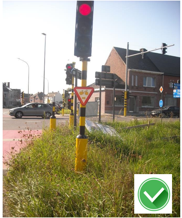
Hof van Oranje, voor fietsers naar rechts telt geen rood!