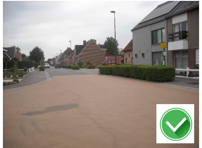
Groenweg: laag gesnoeide haagjes.