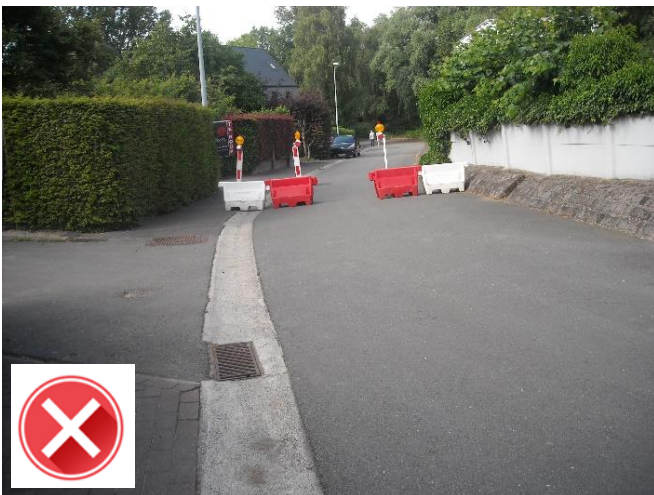
Sint-Martendries: proefopstelling tegen sluipverkeer (OK) maar dwingt fietsers naar mekaar toe.