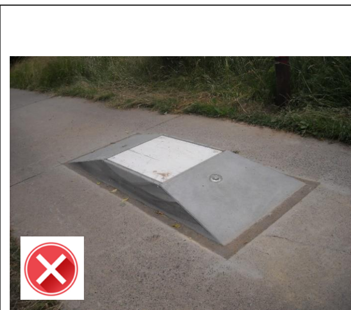
Sparrenbosdreef (en Buhlenslos): ingebouwde reflector (?) van tractorsluis werkt niet. Extra reflectoren ondertussen aangebracht. Nu nog een fluostreep op de sluis voor zichtbaarheid overdag.