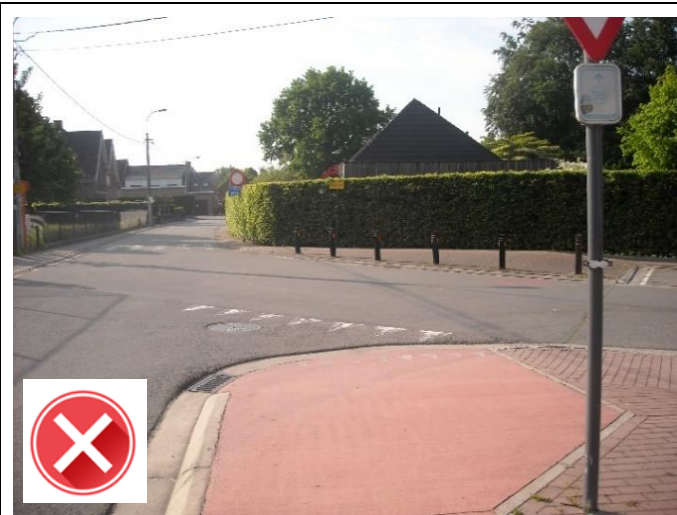
Vrije Basisschool Balegem: fiets-opstelstrook ontbreekt.