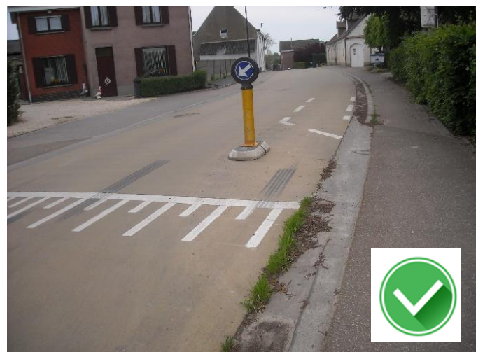
Van Thorenburghlaan: rugdekkung met ledlampjes in de voet en remsporen (?).