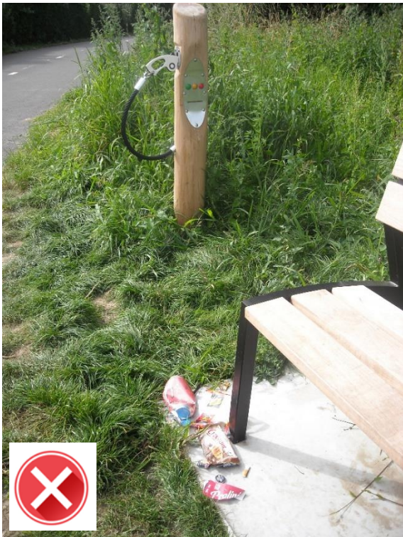
Fietspad langs spoorweg Balegem: zwerfvuil aan het "tankstation" wegens ontbreken van afvalbak.