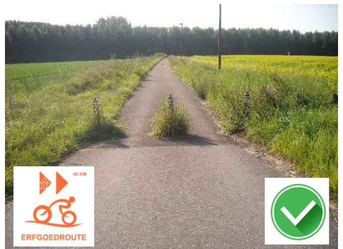
Boekhoutstraat - Steentjeswegel: erfgoedroute loopt langs veilige trage wegen door velden en bos.