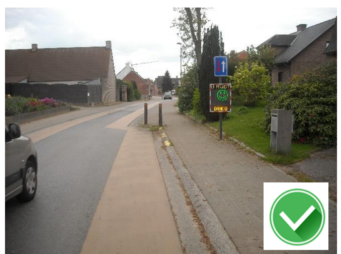
Meerstraat: eerst sensibiliseren , dan verbaliseren.