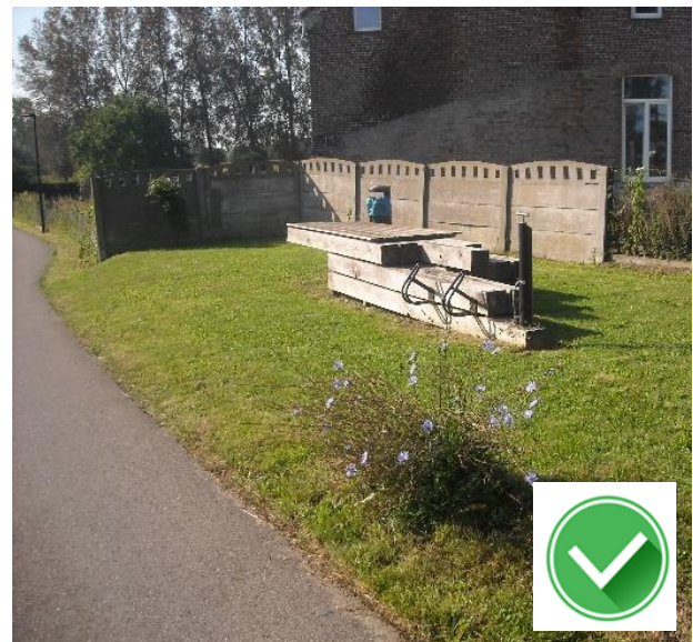
Balegem-Zuid: verpozen in 't groen op bankje met fietspomp, parkeerbeugel en afvalbak.