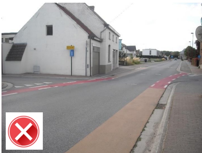
Houtemstraat – Scheurbroek: fietsers moeten zonder rugdekkung op de rijbaan.