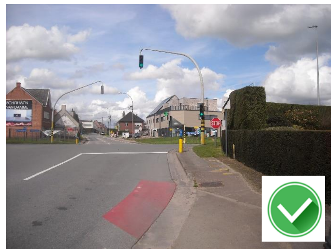
N42: lichtengeregelde oversteek aan Houtemstraat.