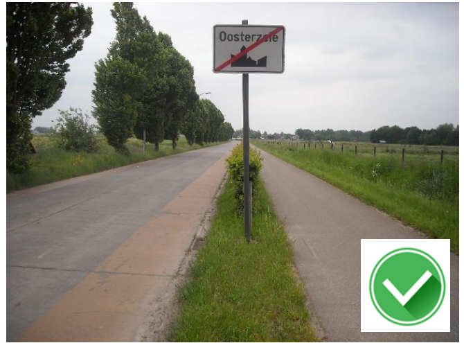
Meerstraat: breed vrijliggend 2-richtingsfietspad.