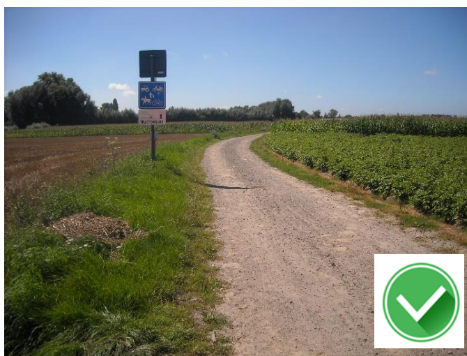
Buhlenslos: nieuwe goede trage-wegverbinding Peperstraat – Gaversesteenweg.