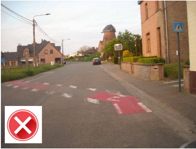
Molenstraat: te smal 2-richtingsfietspad en zicht voor oversteek naar links soms belemmerd door geparkeerde auto's.